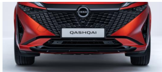
Inserts de finition avant