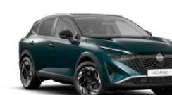
VERT CAYUGA / TOIT NOIR - YBJ