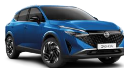
BLEU MAGNÉTIQUE - RCF