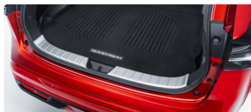
Protection seuil de coffre