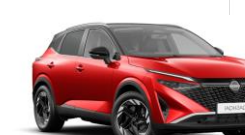
ROUGE FUJI / TOIT NOIR - YAU