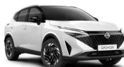
BLANC NACRÉ / TOIT NOIR - XKJ