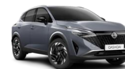
GRIS ARGILE - KBY