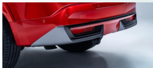
Inserts de finition arrière