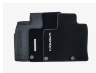
Tapis de sol (caoutchouc, luxe ou velours)