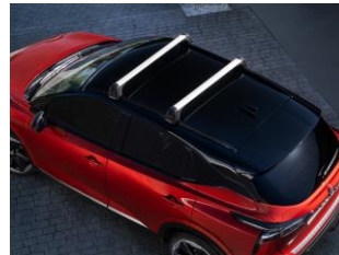
* Barres de toit transversales