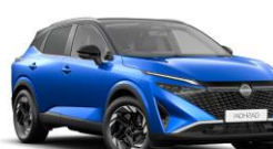
BLEU MAGNÉTIQUE / TOIT NOIR - XGZ