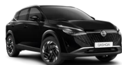
NOIR KURO - GAT