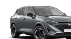
GRIS ARGILE / TOIT NOIR - XFU