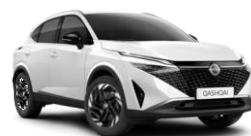
BLANC NACRÉ - QBE