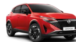
ROUGE FUJI - NBV (gratuit)