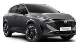
GRIS SQUALE - KAD