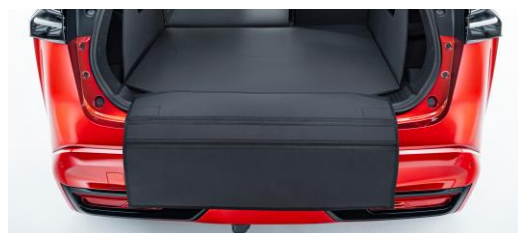
Protection de pare-choc arrière