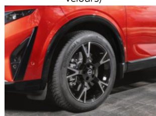
**Jantes alliage 19"