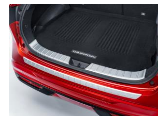
Protection d'entrée de coffre

Chaque trajet à bord du Nissan Qashqai mérite d'être unique. Pensés dans les moindres détails, les accessoires Nissan prolongent l'expérience de conduite en alliant design, innovation et fonctionnalité. Que ce soit pour plus de confort, de sérénité ou de caractère, notre gamme d'accessoires vous permet de façonner un Qashqai à votre image et de profiter pleinement de chaque instant sur la route.