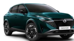
VERT CAYUGA - FAP